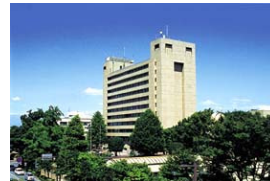
さいたま市役所&浦和区役所